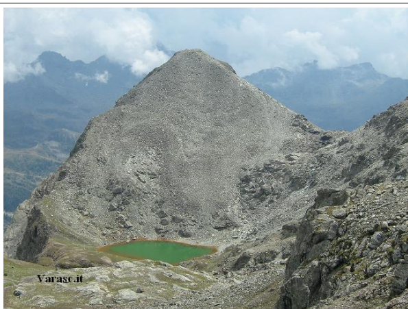
Il Monte Croce e il Lago Verde

Prolungamento opzionale: Colle e M.te Croce 2.894 m Dal rifugio si prende a sinistra , direzione NE sentiero n° 4, fino ai laghi Croce 2.586 m da e qui ci sono due alternative di salita . La prima: subito a destra dei laghi un sentiero sale ad un colle da cui parte la cresta meridionale; il percorso, intuitivo ma faticoso ed esposto, porta alla vetta del M.te Croce. La seconda: si transita alla sinistra dei laghi attraversando un pendio erboso, si sale in direzione Nord dopo aver superato l'immissario del lago, si arriva a un caratteristico spiazzo proseguendo poi fino al Colle Croce 2.801 m. Dal colle si volge a destra risalendo l'ampia dorsale fino alla vetta del Monte Croce 2.894 m .