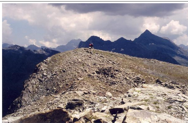
La vetta del Monte Croce dall'anticima

Discesa: Lungo l'itinerario di salita. Oppure dal colle un sentiero scende direttamente a Saint Jacques (da verificare)