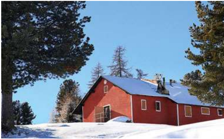
la Capanna Mautino