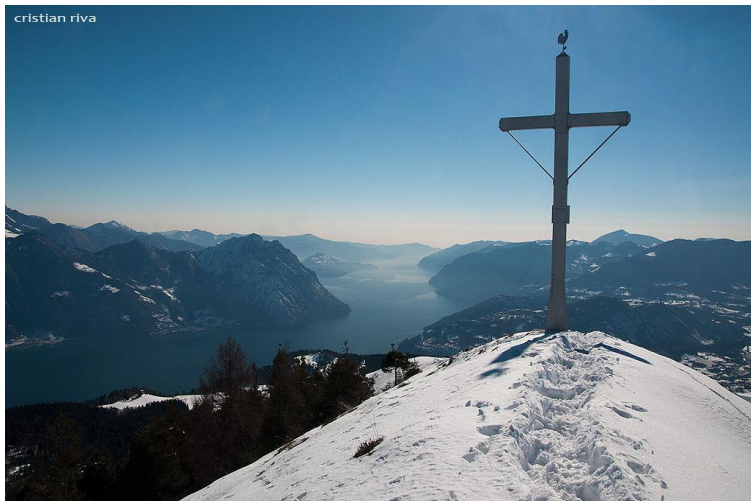
La vetta con la sua grande croce

Coordinatore Logistico: Angelo Vismara Conduzione: Gruppo Accompagnatori Percorso Base Tipologia Percorso: Escursionistico ciaspole Difficoltà: EAI-F Segnavia: Cartelli Cartina: Online Esposizione: NW / NE Quota di Partenza: 840 m. Quota massima: 1.458 m. Quota di Arrivo: 840 m. Dislivello: +/- 645 m. Lunghezza complessiva: 10,1 Km Tempo indicativo comp: 5 ore *